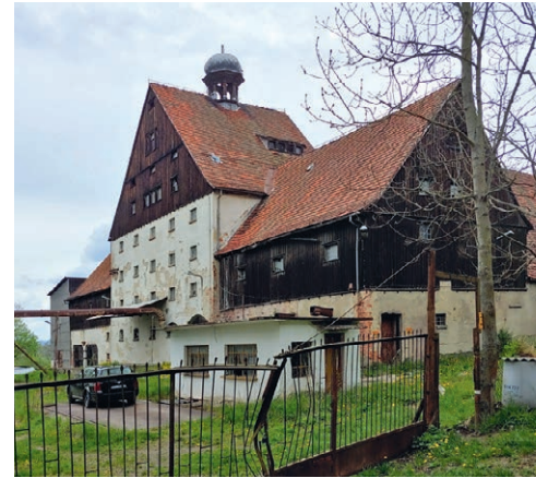
► Dawny młyn w przysiółku Księżno

Wędrując szlakami w okolicach Nowej Rudy, możemy natknąć się na budzący ciekawość charakterystyczny czerwony kolor podłoża. Okoliczne twory geologiczne noszą nazwę czerwonego spągowca, a barwę zawdzięczają m.in. efektowi wietrzenia skał w gorącym i suchym klimacie. Osady te gromadziły się w niecce śródsudeckiej około 270 mln lat temu. Należą do nich m.in. piaskowce, które przybierają kolory od jasnoczerwonego do bardzo intensywnie zabarwionego. Skała jest twarda i trudna w obróbce, ale za to dość odporna na warunki atmosferyczne. Ze względu na te właściwości i niewątpliwe walory dekoracyjne skał tych powszechnie używano w budownictwie. Z utworów czerwonego spągowca zbudowane są m.in. elementy srebrnogórskiej twierdzy, most Zwierzyniecki we Wrocławiu oraz wiele budynków w Nowej Rudzie.